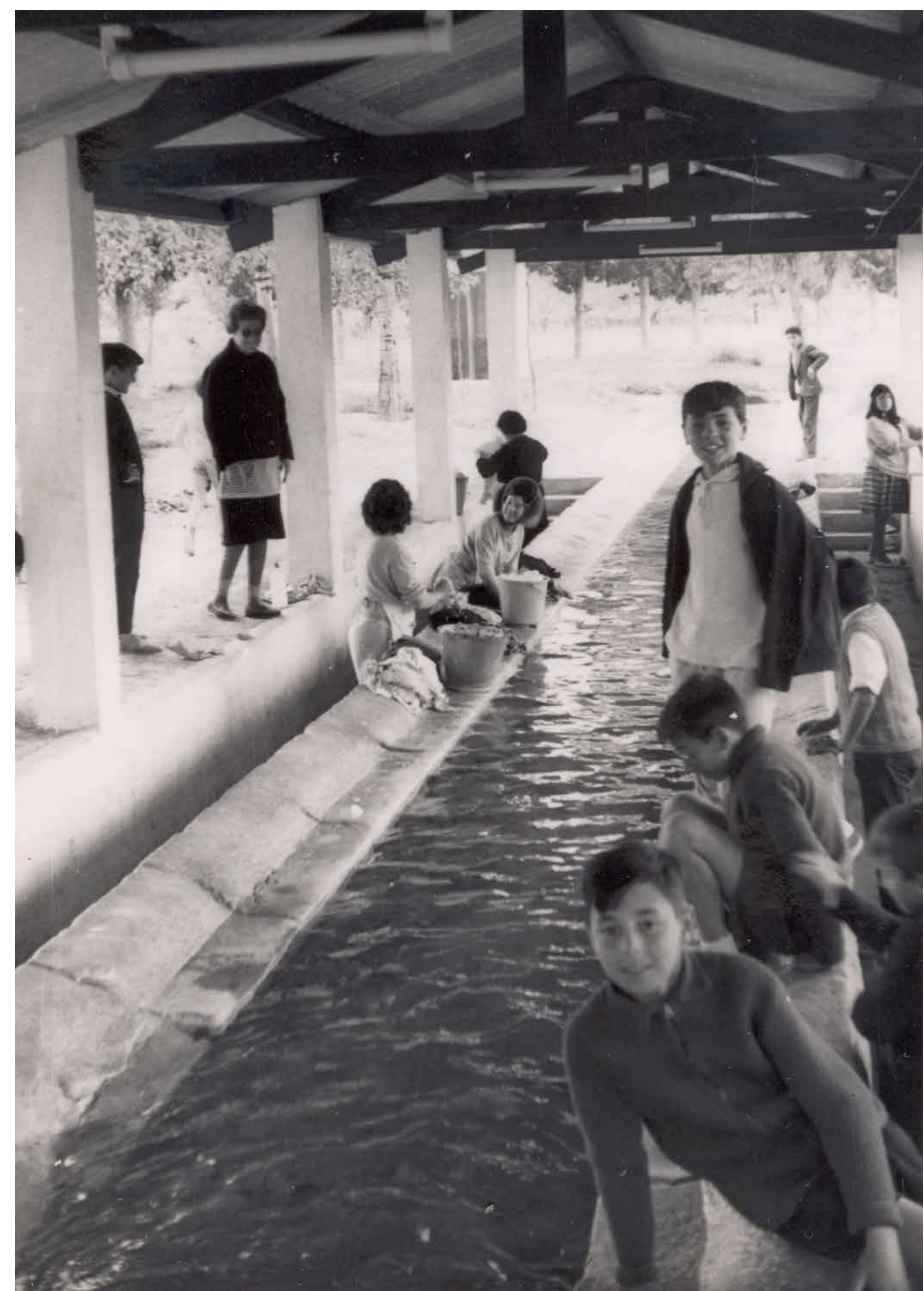
Lavadero del Hondo de las Fuentes, 1960

La calle de los Santos Médicos , cercada por el curso de las dos acequias, fue popularmente denominada como calle del Agua . Las viviendas colindantes con las redes de riego incrementaban su valor por la cercanía al agua, los vecinos se abastecían de las acequias al tiempo que las usaban como red de alcantarillado arrojando desperdicios e incluso edificando algún retrete sobre el cauce. Se instalaron lavaderos de uso público sobre el cauce de las acequias, y el caudal hídrico de éstas se aplicó para impulsar la maquinaria de dos molinos.